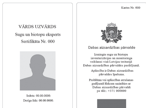
Attēls Nr. 1 Eksperta apliecības paraugs

ES nozīmes aizsargājamo biotopu apzināšana notiek projekta „Priekšnosacījumu izveide labākai bioloģiskās daudzveidības saglabāšanai un ekosistēmu aizsardzībai Latvijā” jeb „Dabas skaitīšana” ietvaros, ko līdzfinansē ES Kohēzijas fonds. Plašāka informācija par projektu, plānotajām aktivitātēm, iedzīvotāju informatīvajiem bezmaksas semināriem pieejama vietnē www.skaitamdabu.gov.lv vai www.daba.gov.lv , jautājumus aicinām sūtīt pa e-pastu skaitam-dabu@daba.gov.lv .