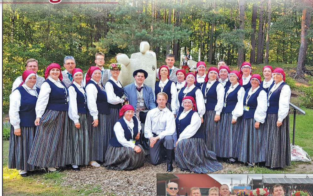
↑ Jauktais koris „Auce” mirkli pirms XXVI Vispārējo latviešu Dziesmu svētku noslēguma koncerta „Zvaigžņu ceļā”.

Paldies visiem novada amatiermākslas kolektīviem un to vadītājiem par ieguldīto darbu – kopā mēs varam radīt skaistus svētkus, ko atcerēsies un pieminēs nākamās paaudzes! Dievs, svētī Latviju!