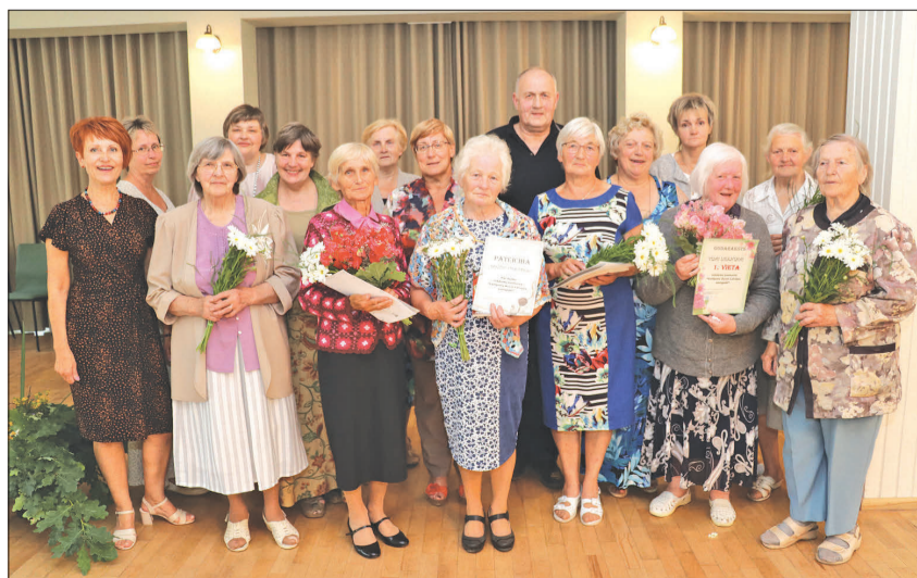
Konkursa „Veltījums Aucei Latvijas simtgadē” dalībnieki noslēguma pasākumā.

Gita Šēfere-Šteinberga Sabiedrisko attiecību speciāliste Autores foto