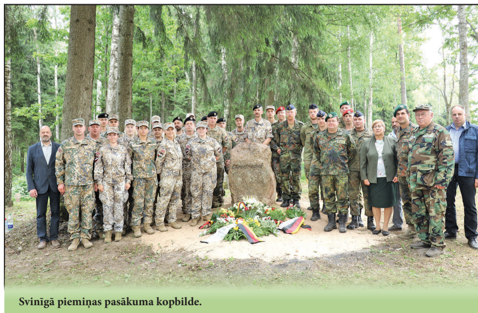
Svinīgā piemiņas pasākuma kopbilde.

Gita Šēfere-Šteinberga Sabiedrisko attiecību speciāliste