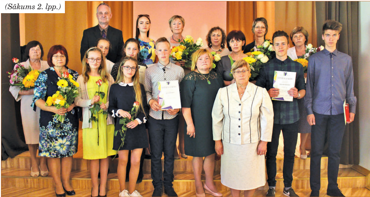
Auces un Bēnes vidusskolas audzēkņu, skolotāju, direktoru un domes vadības kopbilde.