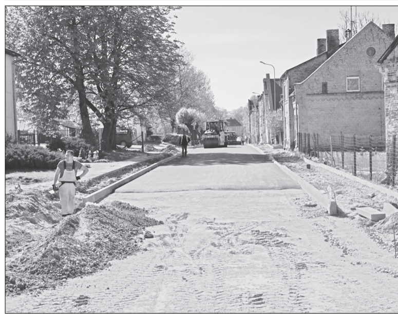
Būvniecības process Miera ielā.