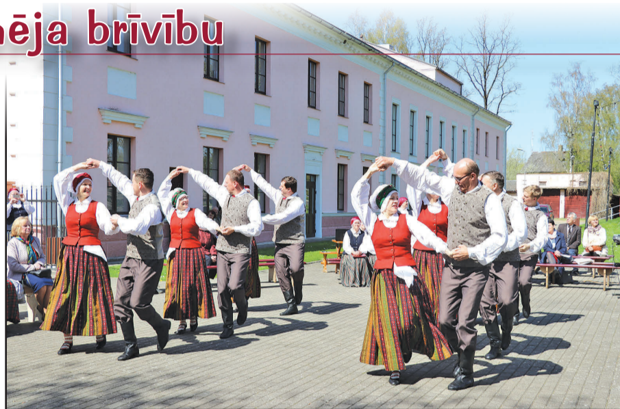
Dejo VPKD „Robežnieki”.

1990. gada 4. maija notikumi, kad Latvijas PSR Augstākās padomes deputāti nobalsoja par Latvijas neatkarības atjaunošanu, ir viens no būtiskākajiem Latvijas vēstures pagrieziena punktiem. Ar Augstākās padomes deklarāciju „Par Latvijas Republikas neatkarības atjaunošanu” atjaunoja Latvijas Satversmi. Vienlaikus šī deklarācija pasludināja 1940. gada 17. jūnija PSRS militāro agresiju par starptautisku noziegumu un atjaunoja Latvijas Republikas suverenitāti. 4. maijs mums ir devis otru elpu, atvēris ne tikai robežas, bet arī acis, sirdis un prātus. Priecāsimies par to, kas