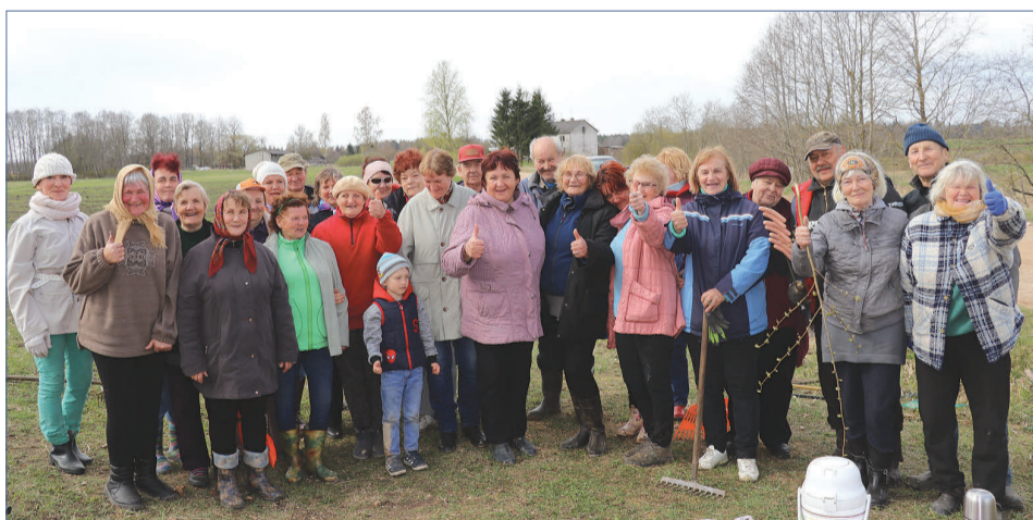
Talkotāji pie Dobes kalniem Kokmuizā.