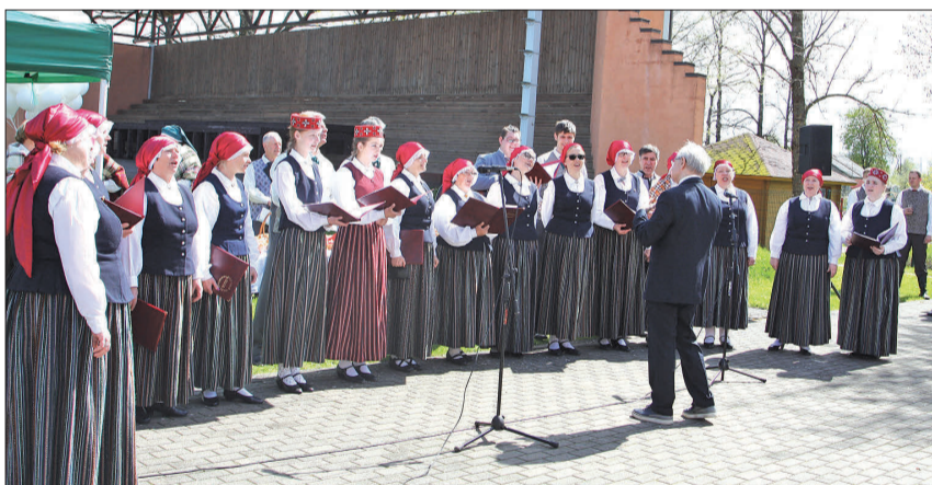
Dzied jauktais koris „Auce”.

Gita Šefere-Šteinberga Sabiedrisko attiecību speciāliste Autores foto