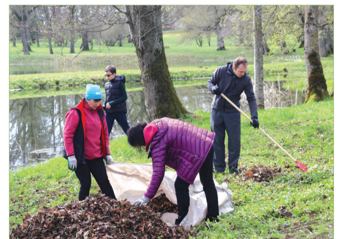
Daļa no talkotājiem Vecauces pils parkā.