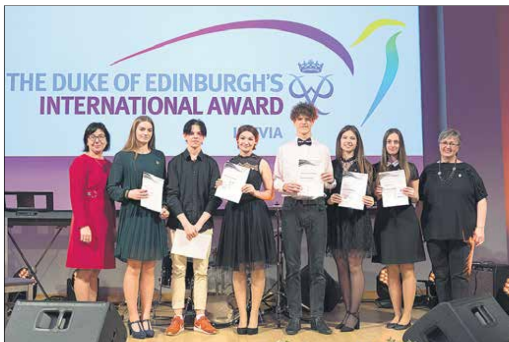
Auces vidusskolas "Award" vienības dalībnieki.

Šogad 64 bronzas, 33 sudraba un 6 zelta līmeņa Edinburgas hercoga starptautiskos apbalvojumus saņēma "Award" dalībnieki no Aknīstes Bērnu un jauniešu centra, Aknīstes vidusskolas, Auces vidusskolas, Carnikavas pamatskolas, biedrības "DUEsport", biedrības "Suitu kultūras mantojums", Bikstu pamatskolas, Dobeles Jaunatnes un veselības iniciatīvu centra, Mežinieku pamatskolas, Daugavpils 11. pamatskolas, Gulbenes novada valsts ģimnāzijas, Kandavas multifunkcionālā jau-