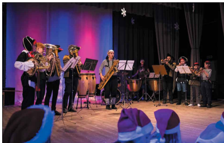
Muzicē Ziemassvētku „Brass Band”