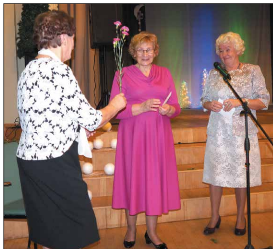
27. decembra pēcpusdienā Auces pensionāru biedrība pulcēja kopā gan Auces novada seniorus, gan tuvākus un tālākus draugus no citiem Latvijas novadiem

Ilmārs Matvejs, Attīstības nodaļas vadītājs