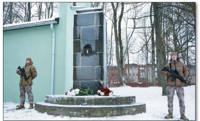
Goda sardze pie O. Kalpaka pieminekļa

Pelēkā granīta piemineklis Lielaucē tika atklāts 1934. gada 19. augustā. 1950. gados piemineklis ticis iznīcināts, paglābjot tikai tā galveno, uz pusēm sašķelto, plāksni. Šī vieta ir kļuvusi nozīmīga Auces novada iedzīvotājiem un visiem