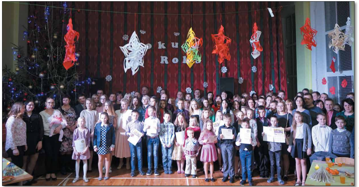
„Roku rokā” kopbilde

11. janvārī svin arī Starptautisko „paldies” dienu. Šie svētki ir sākušies pēc ANO un UNESCO iniciatīvas. Latviešu valodā „paldies” ir cēlies no vārdu salikuma „palidzi,