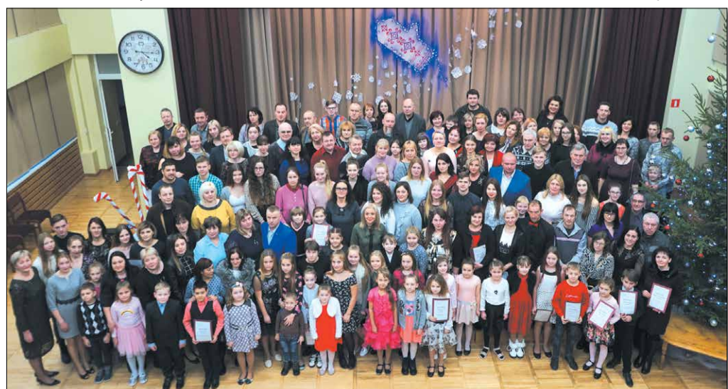
Zvaigžņu dienas dalībnieku kopbilde

Svinīgo pasākumu atklājot, Auces vidusskolas direktore sacīja: „Šodien tradicionāli tiek godināti paši centīgākie un čaklākie skolēni, kuri ar savu darbu ik gadu apliecina, ka viņi tiešām ir cienīgi šād un tad saukties par zvaigžņiem. Šogad uz Zvaigžņu dienu ir aicināti 172 skolēnu vecāki. Tas ir pietiekami liels skaits un nebūt ne mazāks kā pagājušā gadā, pat mazliet lielāks nekā 2015. gadā. Ar pilnu atbildību varu teikt, ka labi mācīties Auces vidusskolā ir modernī! Par to gan man, gan kolēģiem, gan, visticamāk, arī jums, vecāki, ir ļoti liels prieks. Auces vidusskolā ir nodibināti dažādi apbalvojumi, lai skolēni vēlētos tiekties uz augstākiem sasniegumiem. Viens no tradicionālajiem apbalvojumiem ir arī šīs dienas pasākums, kurā teiksim paldies to skolēnu vecākiem, kuru liecībās nav neviena vērtējuma, kas būtu zemāks par sešām ballēm. Tas ir ne vien skolas, bet visas pilsētas un novada lepnums, jo tie ir skolēni, kas mūsu vārdu nesīs tālāk visā Latvijā un, iespējams, arī pasaulē. Lai šādi sasniegumi bērniem būtu, liels nopelns ir viņu vecākiem, tādēļ lielu paldies šodien mēs vēlamies teikt tieši viņiem.”