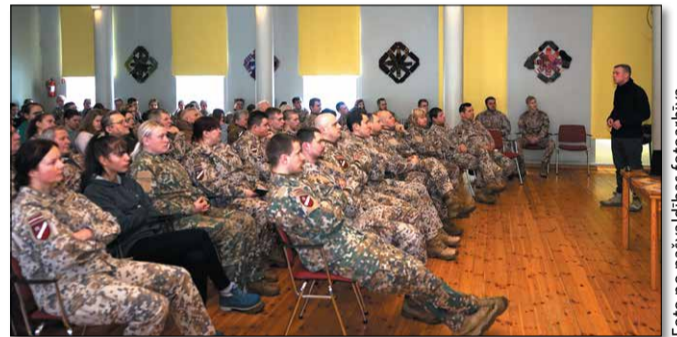
Pēc piemiņas brīža visi pulcējās Lielaucē Tautas namā

latviešiem, lai ik gadu no jauna pulcētos un atcerētos tālo 1919. gadu.