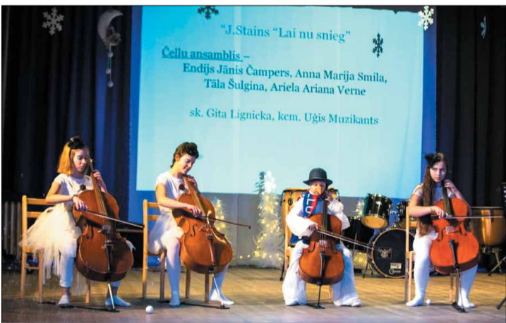
Muzicē čella klases audzēkņi – sniegavīri