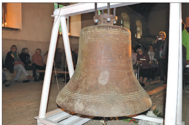
Jaunaucē zvanam tagad mājvieta rasta Īles luteriskajā baznīcā.

Gita Šēfere-Šteinberga, sabiedrisko attiecību speciāliste