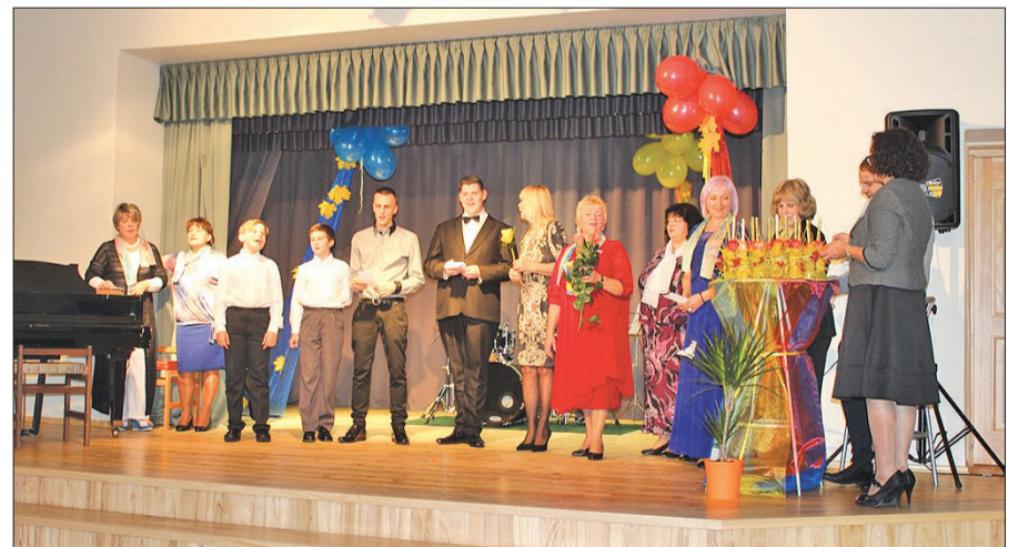
Skat kopdziesma „Vislabākā skola”.