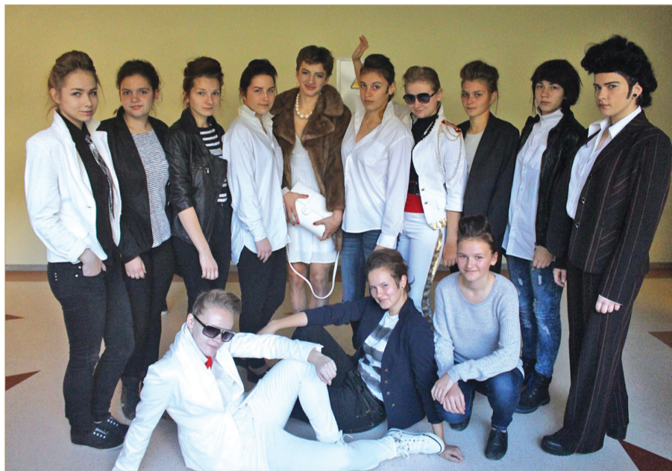
Auces vidusskolas 10. klases pārvērtības.

Auces vidusskolā no 17. līdz 20. oktobrim norisinājās ikgadējais pasākums, kas ir īpašs tieši 10. klases skolēniem – iesvētības, kad „fukši” oficiāli tika iecelti vidusskolēnu kārtā.