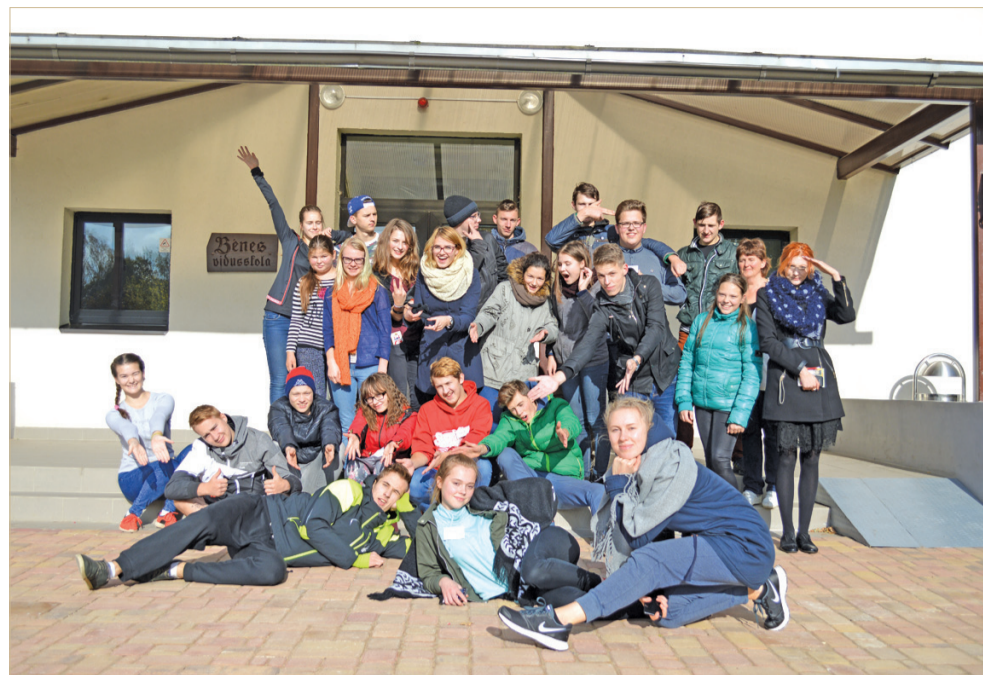
Eiropas klubu dalībnieku vidū valdīja draudzīga atmosfēra.

sajūtu un to, ka pasākums bija izdevies, raksturo ieraksti Eiropas kluba viesu grāmatā: