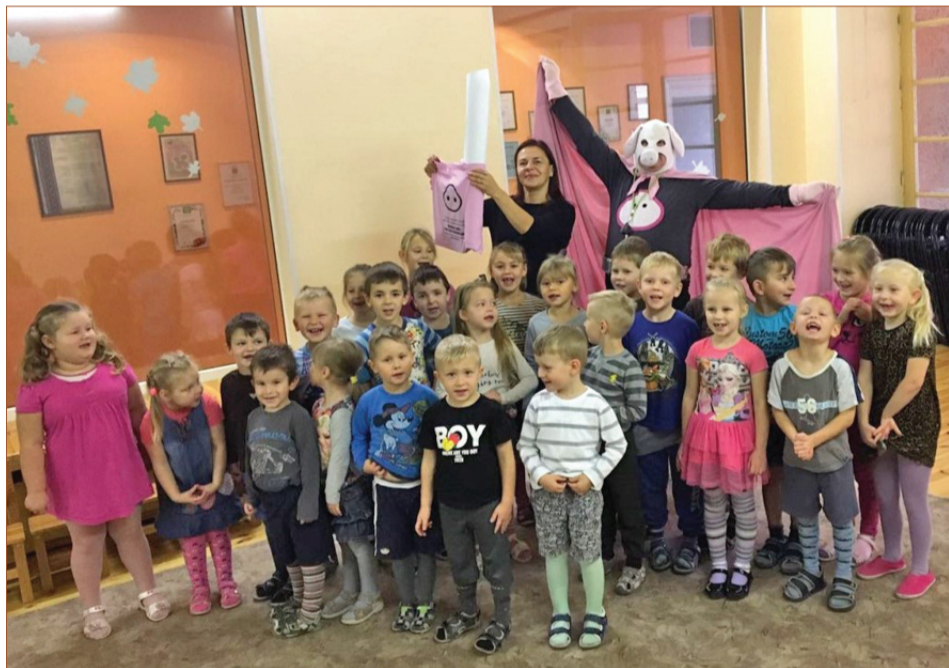
Cūkmens viesojās PII „Vecauce”.

27. oktobra rītā PII „Vecauce” viesojās pats Cūkmens, lai nodotu Slepno maisu no VAS „Latvijas valsts meži” ar papildus mācību materiāliem un novēlētu bērniem veiksmīgu darbošanos atklājot dažādus dabas noslēpumus. Tikšanās laikā bērni pastāstīja par savu veikumu dabas saudzēšanā un kopā ar Cūkmeni nodziedāja Netīro mežu himnu. Cūkmens iepazīstināja bērnus un pedagogus ar veicamajiem darbiņiem un atvadījās uz tikšanos atkal pavasarī.