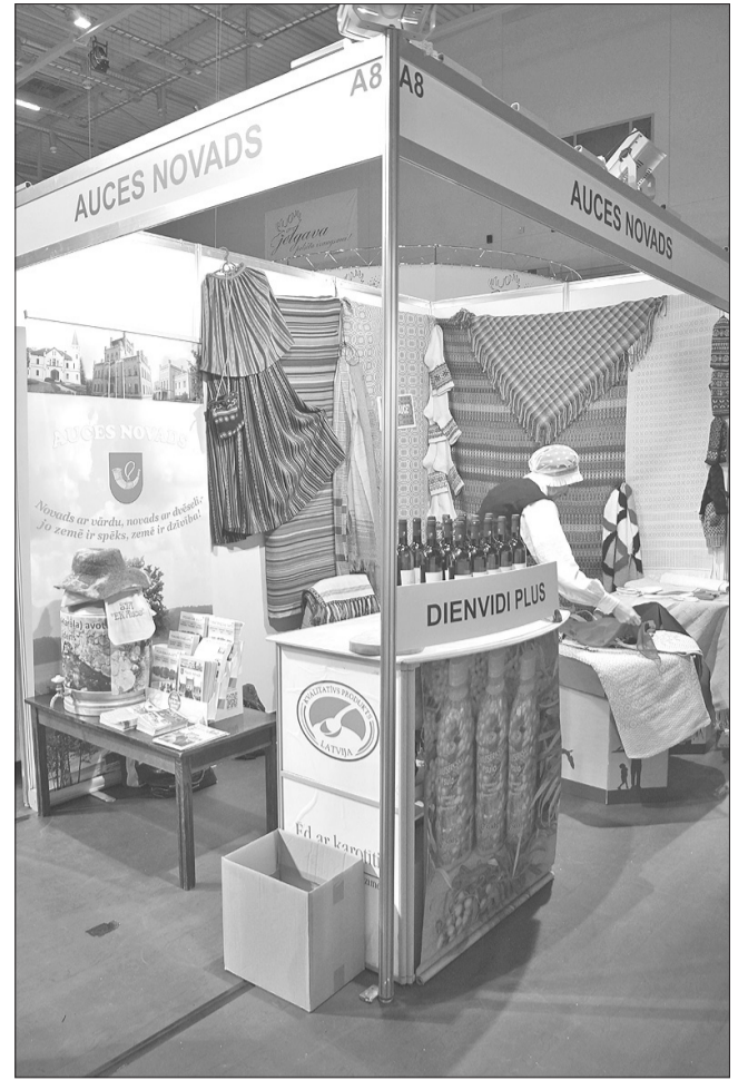
Auces novada stends „Uzņēmēju dienas Zemgalē 2016”.

Evija Želve-Šlaudere, Auces novada tūrisma informācijas konsultante