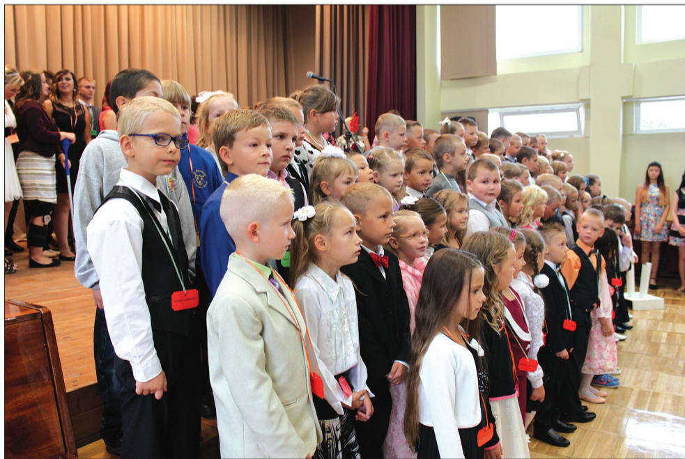
Brašie Auces vidusskolas pirmklasnieki.

Rudenīgi saulains pienācis oktobris, taču vēl pirms mēneša visi svinējām Zinību dienu, pēc saulainās vasaras tā simboliski iezīmējot rudens sākumu.