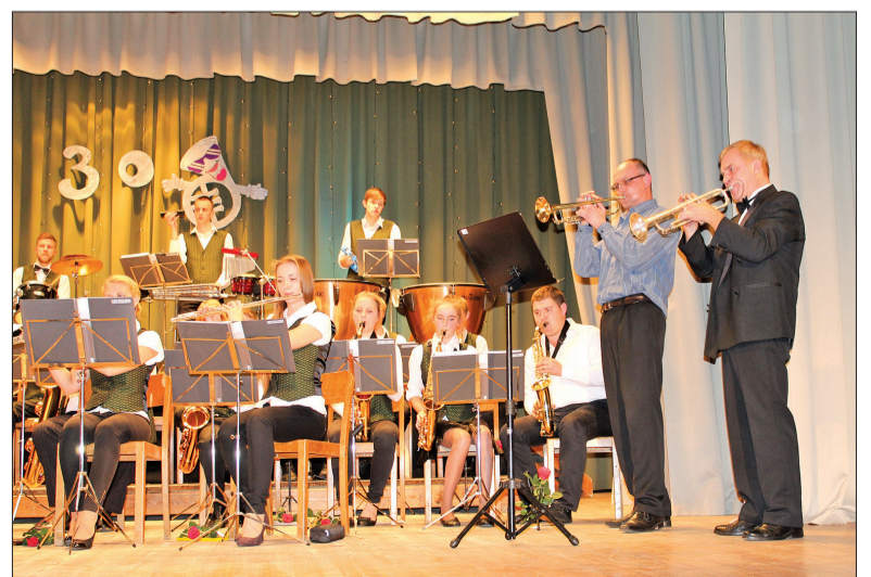
Muzicējot PO „Auce” 30 gadu jubilejas koncertā.