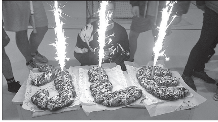
Salūts uz svētku kliņģera.

6. decembrī Īles pagasta sporta zālē notika jaunās grīdas atklāšanas pasākums. Grīdas atklāšanas pasākumā notika draudzības spēles volejbolā, kur īleniekiem pretī stājās Aucē apvienotā volejbola komanda. Visinteresantākā draudzības spēle izvērtās basketbolā. Īles komandai pretī stājās penkulnieki, kuri šoreiz gan uzvarēja īleniekus ar rezultātu 107:89, bet solija atbraukt atkal un mēģināt nākošreiz neuzvarēt. Pēdējā draudzības spēle bija kā saldais ēdiens, jo tā bija florbola draudzības spēle. Kā zināms, tieši florbolu īlenieki mīl visvairāk. Pasākuma beigās visi sportisti un līdzjutēji kopā apēda svētku kliņģeri. Lai jaunā grīda labi kalpo!