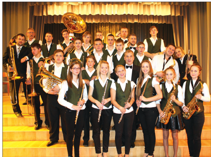
Visi orķestranti kopā.