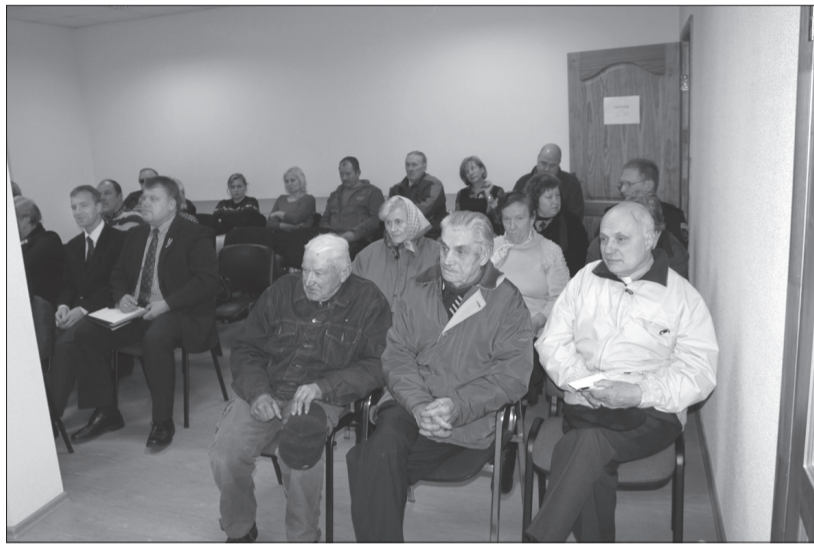
Iedzīvotāju sapulces dalībnieki Īlē.

2014. gada nogale pagastos iezīmējās ar notikumiem, kas no pagājušā gadā Īlē notikušās iedzīvotāju sapulces kā tradīcija tiek turpināta arī šogad. 6. novembrī Īlē, 20. novembrī Bēnē un 4. decembrī Ukros pagastu ļaudis bija sapulcējušies pagastu pārvaldēs, atsaucoties pārvaldnieku aicinājumam, lai noklausītos pārvaldnieku stāstījumā par paveiktajiem un plānotajiem darbiem, kā arī lai noskaidrotu sev interesējošus jautājumus, tos uzdodot kādam no pašvaldības administrācijas nozaru speciālistiem.