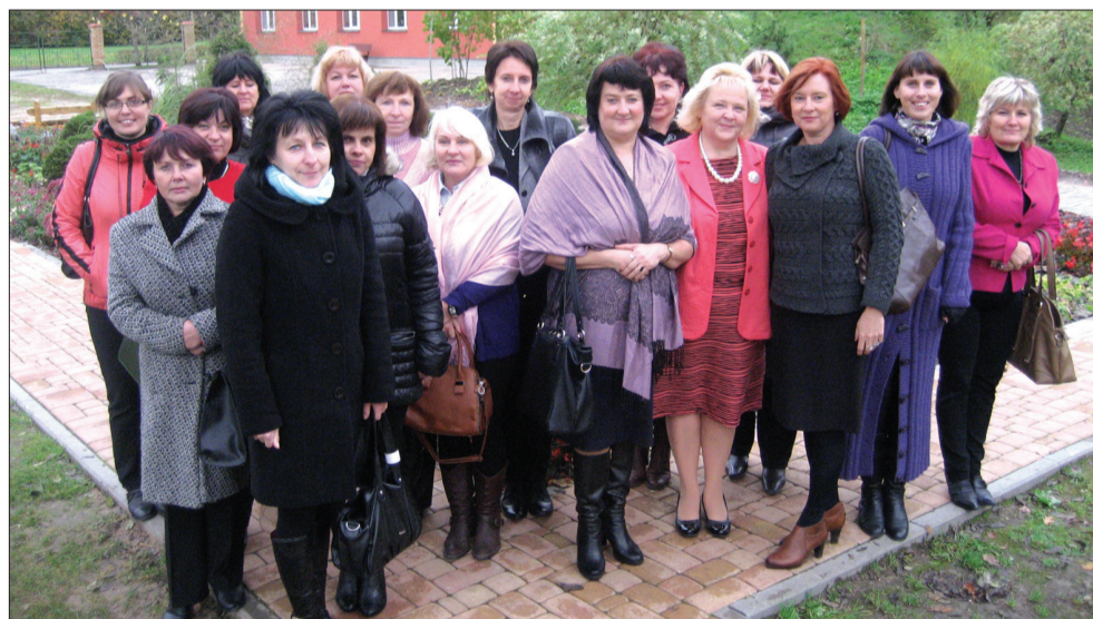
PII „Pilādzītis” komanda kopā ar viesiem no Lietuvas.

Oktobra beigās PII „Pilādzītis” viesojās ciemiņi no Lietuvas – Jonišķu bērnodārza „Vyturēlis”.