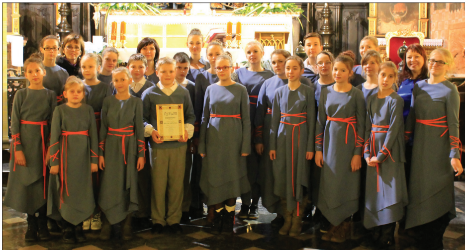
„Dziediņš” ar Sudraba diplomu.

Sallija Bankevica, Auces Mūzikas skolas direktore