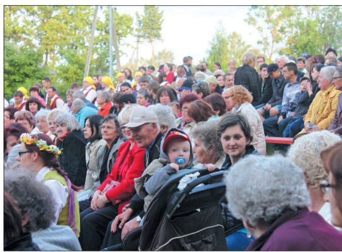
Vēsturiskā notikuma liecinieki – visu paaudžu bēnenieki.