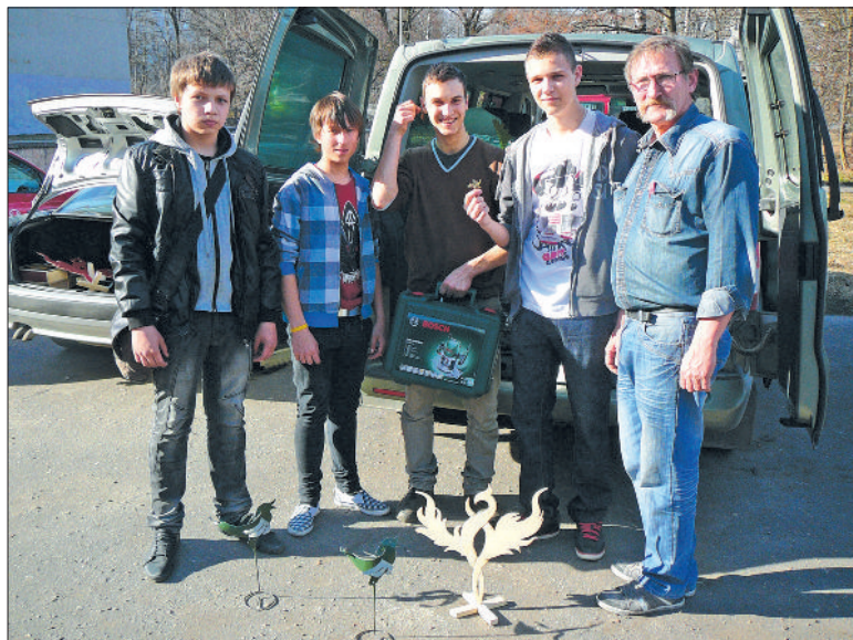
Meistars kopā ar saviem audzēkņiem šī gada olimpiādē.

– Pagājušajā gadā, pateicoties viņu sasniegumiem, arī es tiku pie „Grand Prix” – par mūža ieguldījumu. Man tika uzdāvināts lielais galda futbols, kuru tagad puikas spēlē starpbrīžos. Zēni arī ierindojās godalgotās vietās.