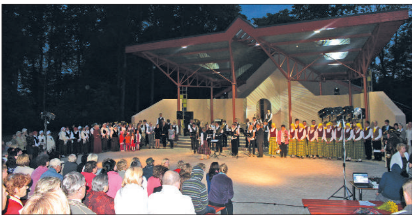
Jaunā estrāde godam iedziedāta un iedancota.