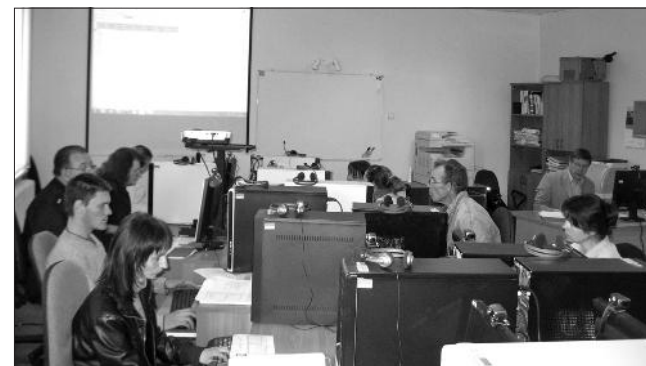
Datorzinību kursu nodarbībā.

Komplektējot grupas pēc kuponu sistēmas, grupā var iesaistīt arī apmācāmos, kas nav bezdarbnieki un mācību maksu sedz paši. To jau ir