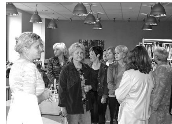
Tukuma novada bibliotēkā.