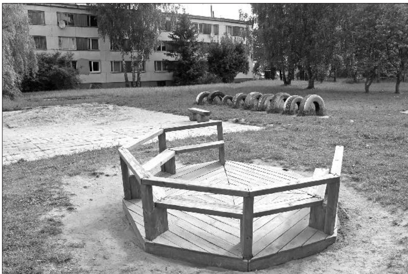
Pašreizējais bērnu rotaļlaukums Kevelē.