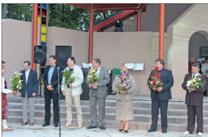
Paldies par jauno estrādi – novada vadībai un iecerēs īstenošanai.