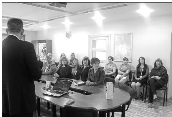
Vērojam prezentāciju Tukuma novada pašvaldībā.