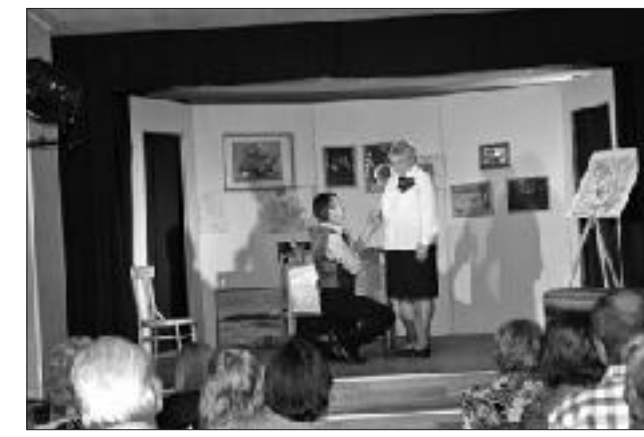
Savu sniegumu rāda „Ukri”.