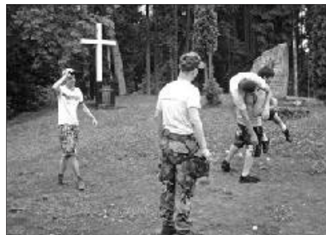
Fiziskais vingrinājums, kā iznest ievainoto no karalauka.