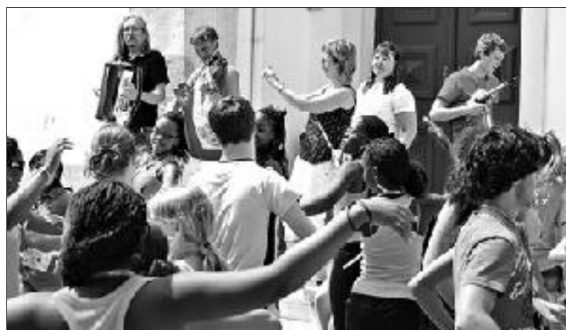
Daudz tika muzicēts arī ārpus koncertiem.