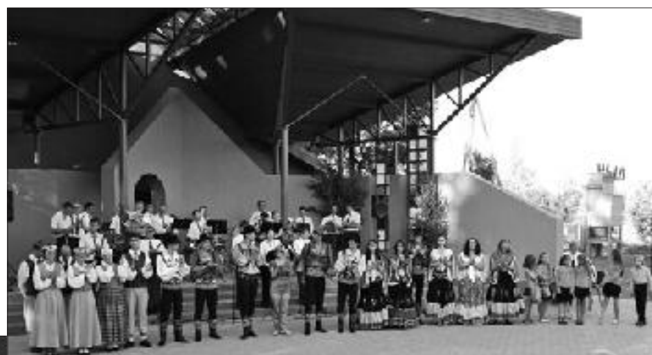
Visi koncerta dalībnieki Bēnes estrādē.