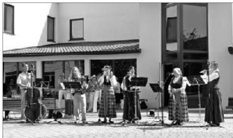
Kapela „Auce” pilnā sastāvā muzicē Auces novada svētkos pilsētas centra laukumā.