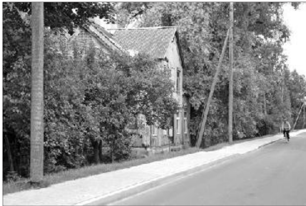
Vītīņu ielas namu saimniekiem nu jābūt par atjaunoto ietvju uzturēšanu.