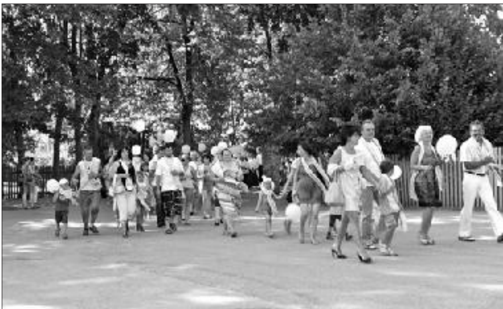
... un „EK Auce” ļaudis.