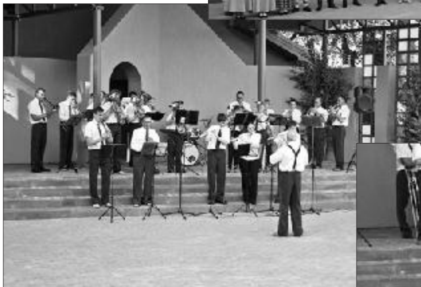
Muzicē Jonišķu pūtēju orķestris.

Pozitīvās enerģijas apmaiņa koncertā notika! Bija izjūta, ka visi pie mums jutās labi. Vēlreiz paldies visiem Bēnes atsaucīgajiem cilvēkiem un mūsu viesiem! Novada Kultūras centram un pašvaldībai paldies par iespēju vērot lieliskus kolektīvus!