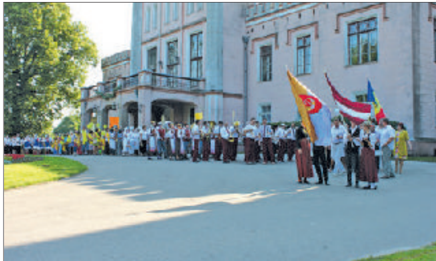
Svētku gājiens šogad sākas pie Vecauces pils.

Tika sumināti konkursa „Auces novads – sakopts un zaļojošs novads”, kas novadā norisinājās otro gadu, laureāti septiņās nominācijās.