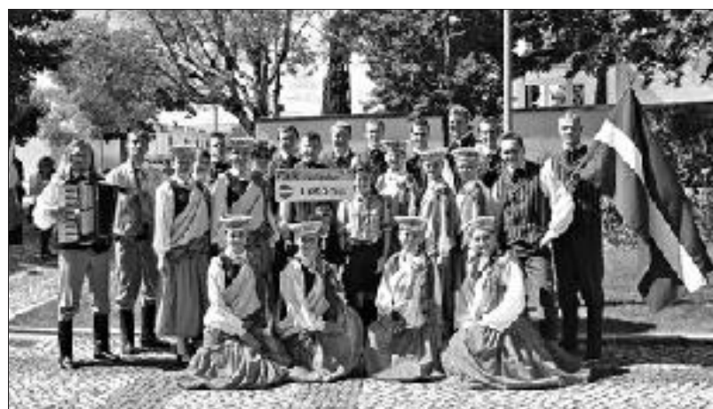
„Kalve” un „Auce” pirms festivāla svētku gājiena.