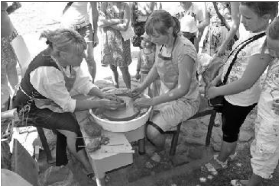
Meistaru ielā ikviens varēja izmēģināt roku dažādās prasmēs.