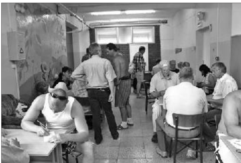
Auces vidusskolas telpās notika zolītes turnīrs.