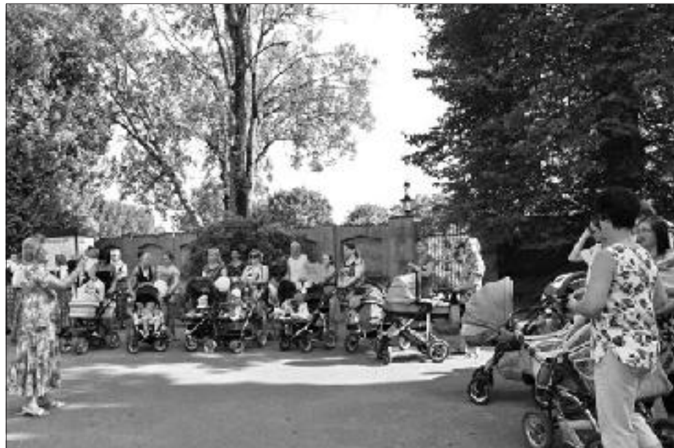
Svētku gājienam kuplā pulkā gatavas jaunās māmiņas.