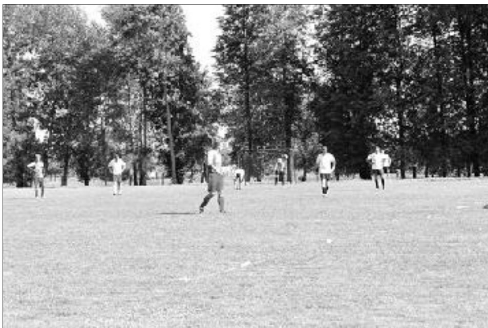
Futbola laukumā sacentās desmit komandas.