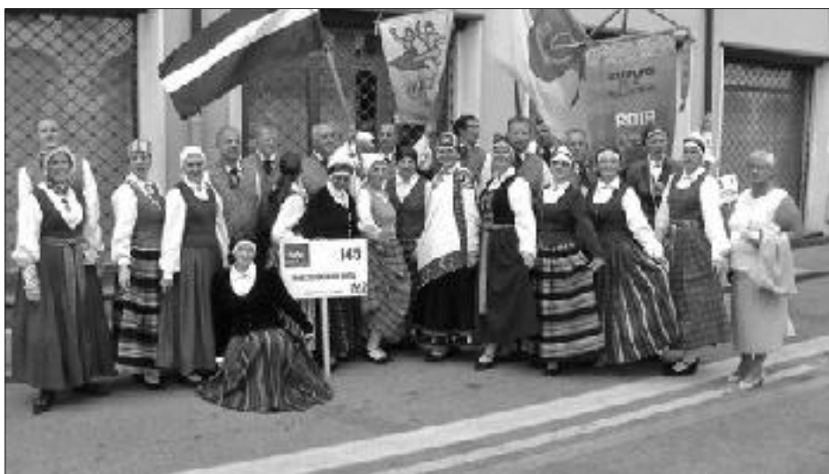
Gatavi gājienam pa Padujas ielām.