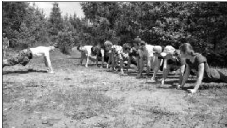
Pārgājiena dalībniekiem jāgādā par savu fizisko rūdiņu.