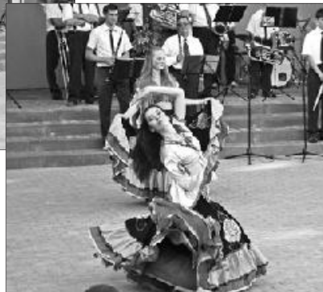
Moldāvu jaunieši izpildīja arī ugunīgu romu deju.