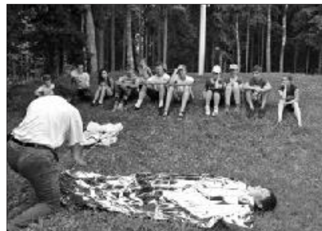
Norit lekcija par pirmās palīdzības sniegšanu.