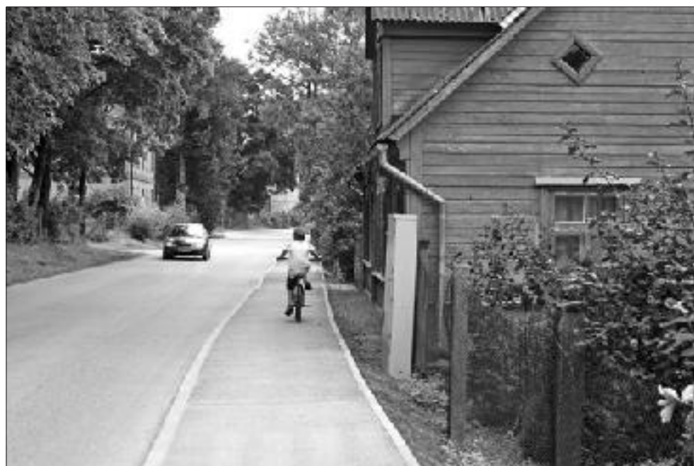
Kapsētas iela Aucē.