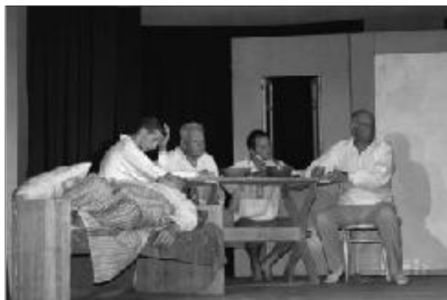
Uzstājas Vītiņu „Mežrozīte”.