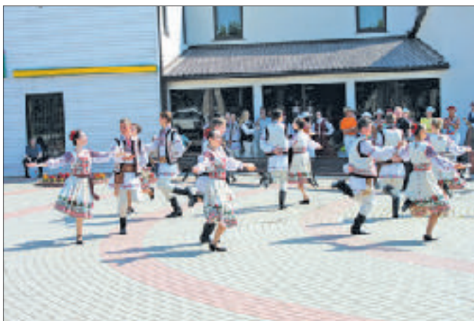
Moldovas Ungheni pilsētas deju kolektīvs „Struguras” uzstājas Auces centra laukumā.