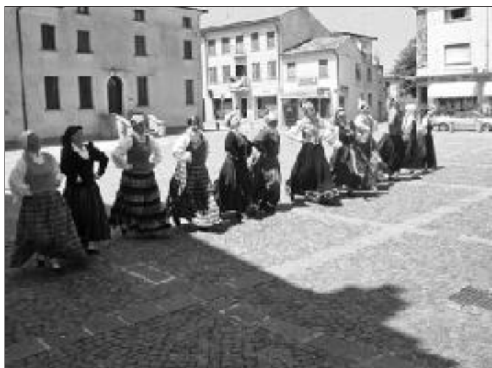
„Robežnieku” meitenes izpilda „Kreichburgas polku”.