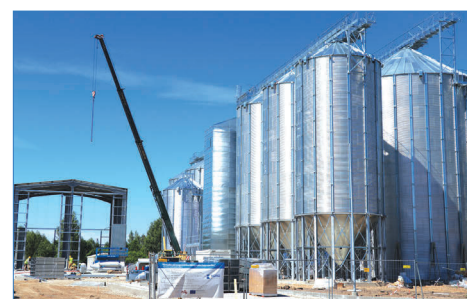
AS „Balticovo” graudu komplekss.

AS „Balticovo” ir uzņēmums ar vairāk nekā 40 gadu pieredzi olu un olu produktu ražošanā. Uzņēmums ir orientēts uz darbību Latvijā un starptautiskos tirgos, eks-